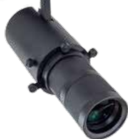
BEAM TRANSFORMER GL